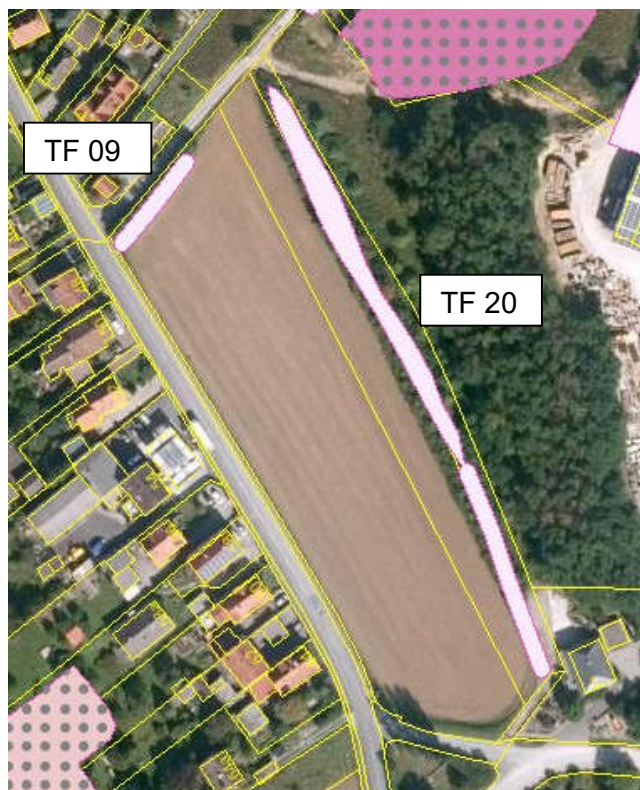
Luftbild mit Biotopkartierung Biotop 6325-0069 (Darstellung ohne Maßstab, genordet)